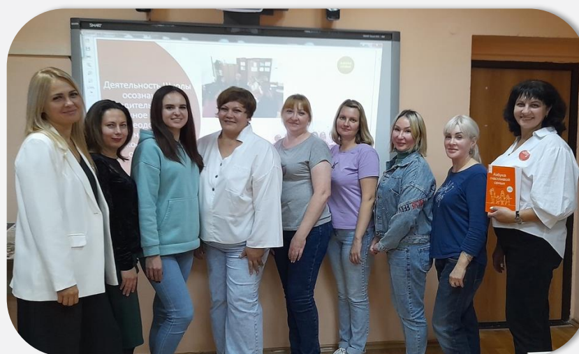
2 поток Школы осознанного родительства ОКТАБРЬ 2023