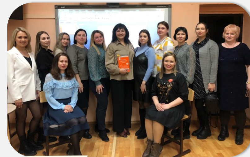
3 поток Школы осознанного родительства МАРТ 2024