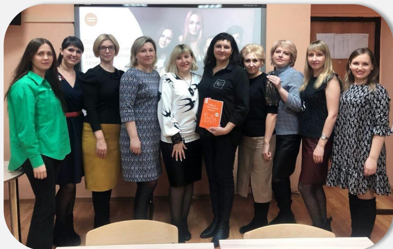
1 поток Школы осознанного родительства МАРТ 2023

На всем моем жизненном пути я постоянно пополняю свои знания и каждый раз открываю для себя что-то новое. В 2022 году я прошла обучение и являюсь сертифицированным лидером Школы осознанного родительства, в марте 2023 года на базе МОУ «Майнский многопрофильный лицей» открыла первый поток Школы осознанного родительства. Работая с данной группой, появилась идея создания проекта «Счастливы вместе» и вся дальнейшая работа проходит по данному проекту. Занятия проводятся 1 раз в неделю, после рабочего дня в группах от 8 до 15 человек.